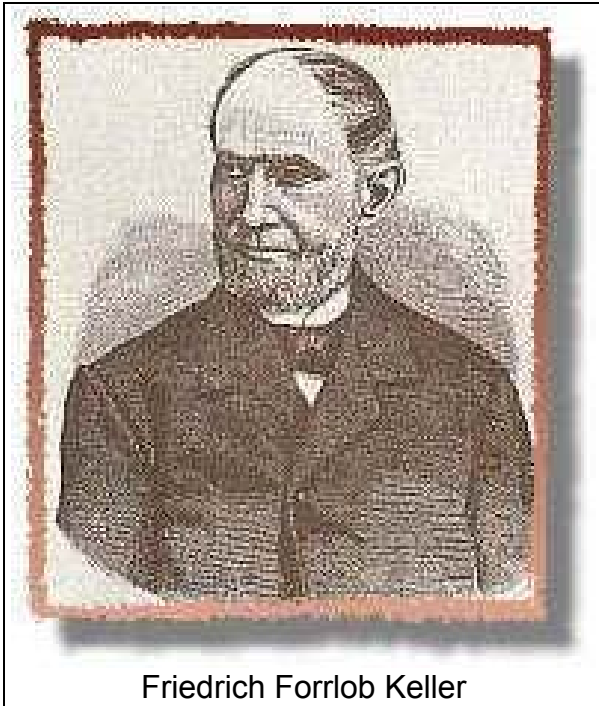
Friedrich Gottlob Keller

Friedrich Keller wurde als Sohn eines Weber- und Blattbindermeisters geboren, der in Heimarbeit, die schlecht bezahlt wurde, für Verleger Tuche herstellte. Er war das einzige von 10 Kindern, welches das Erwachsenenalter erreichte. Bei seinem Vater erlernte er dessen Beruf und half ihm dann hauptsächlich als Blattbinder, indem er Webblätter zum Führen der Kettfäden und zum Anschlagen des Schußfadens herstellte.