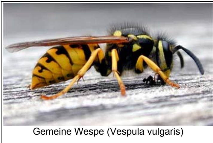
Gemeine Wespe ( Vespula vulgaris )

verschiedenen „Erfindungen“, um seine materielle Lage zu verbessern [1,2].