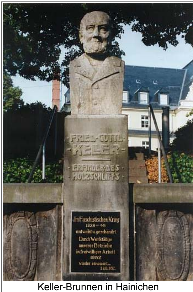
Keller-Brunnen in Hainichen

Als Kind hatte Friedrich Keller durch Schleifen von Kirschkernen Ringe hergestellt, die er zu Ketten zusammenfügte. Er erinnerte sich, daß dabei eine faserige Masse entstand, die beim Trocknen ein feines Papierblättchen bildete. Im Dezember 1843 konnte er einen Holzfaserbrei herstellen, indem er Holz unter Druck und Zugabe von Wasser an einen rotierenden Schleifstein preßte. Dieser Holzfaserbrei ergab ein grobes, dunkles, aber brauchbares Papier. Da ihm die Praxis der Papierherstellung fremd war, führte er unter großen Mühen weitere Versuche durch [1].