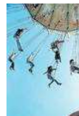
Imagen del Tibidabo