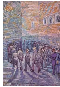
Vincent van Gogh, Die Runde der Gefangenen

Foucault explica que "[...] hay lugares privilegiados, o sagrados, o prohibidos, reservados a los individuos que se encuentran, en relación a la sociedad y al medio humano en el interior del cual viven, en estado de crisis" 9 o sea estado de desviación. Tales lugares pueden ser centros de recuperación, clínicas psiquiátricas, geriátricos, hospitales o cárceles.